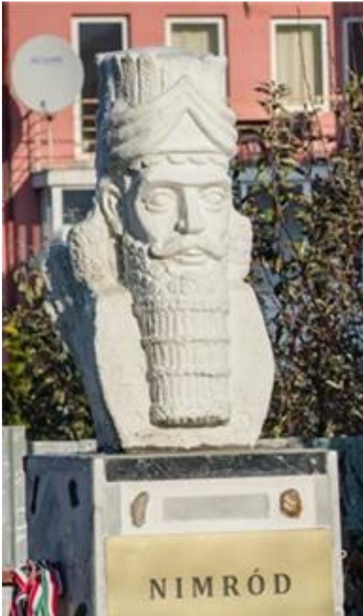
Nimród szobra Kolozsvárott.

Anahita is szárnyakkal volt ábrázolva, lehetséges, hogy a görög legendák szárnyas istenségei és a Kabbala és a Biblia angyalai is ilyen földönkívüli szárnyas humanoidok hiteles ábrázolásai, vagy a szárny csak egy jelkép, mint a szeráfok esetén a hat szárny a térkvantum hat ágát jelképezi.