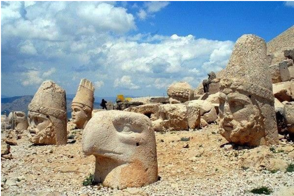
Figurák a török Nemrut-hegy oldalában.

Találtak a Földön, több helyen is óriási csontvázakat, melyek óriási emberekhez tartoznak. A Biblia is ír az óriásokról, a régi babiloni eposzok is óriásokról van szó. Tehát Nimród is ilyen kellett, hogy legyen. A szárnyak a képen lehetnek a magasabb származás jelei, vagy a repülés képessége. Repülni lehet gépi erővel, de lehet levítélva is. Nimród apja Tanaisz király volt, aki szintén nem volt törpe. Anyja a legendás Tündér Ilona (Din-Gir Il-Ama), aki nem földi eredetű, szintén magas, 8-10 méteres lehetett. Lehet szellemi lény, aki testet öltött egy óriásban. A tündér szó jelzi az eltűnő teret (tűnt tér), egy másik dimenzió létét. Kutatni kell, és meg leljük az utat, akár még Narniába is. Fiai az említett Hunor és Magor, de egy Ankisza nevű lányról írnak. A felesége Enéh volt, aki talán azonos Anahitával, akiről az Arvisurában is szó volt. Anahita a csillagok közül jött, Káltes asszony bolygójáról, az Ammáról. Tehát a földönkívüli szál már itt legalább egyszer itt megjelenik, tehát akkor Hunorék is félig földönkívüliek voltak. Bár minket, magyarokat amúgy is marslakóknak hívnak a külföldiek.